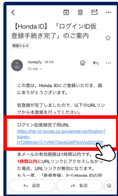
④届いたメールに記載の URLをタップ