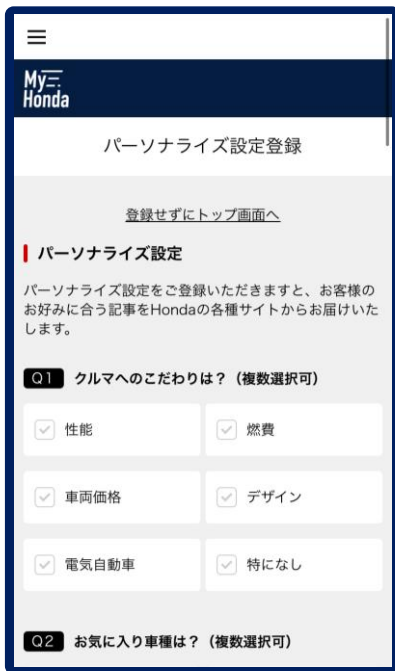
③パーソナライズを設定