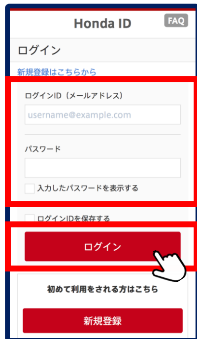
②登録したIDとパスワードでログイン