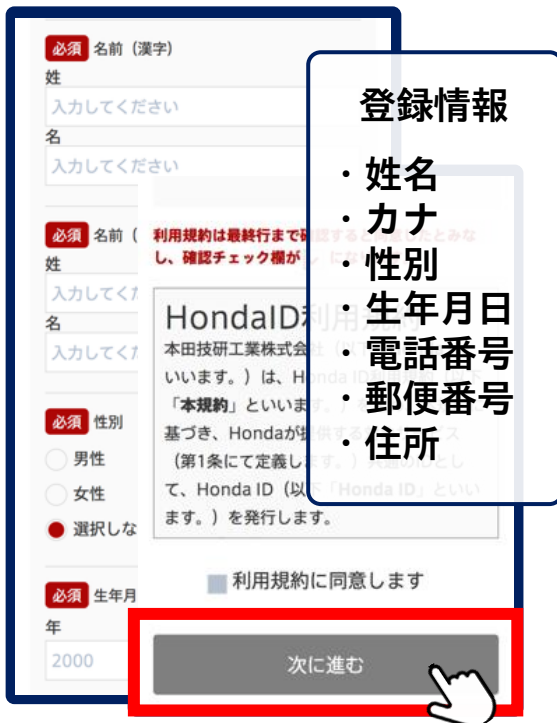
③登録情報を入力利用規約を 確認し「次に進む」をタップ