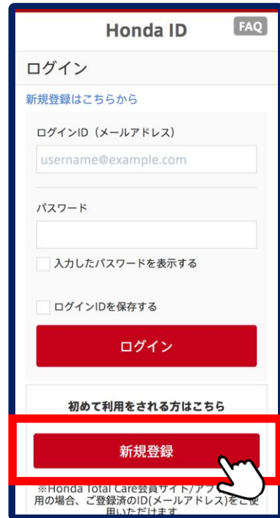
②アプリを立ち上げる 「新規登録」をタップ